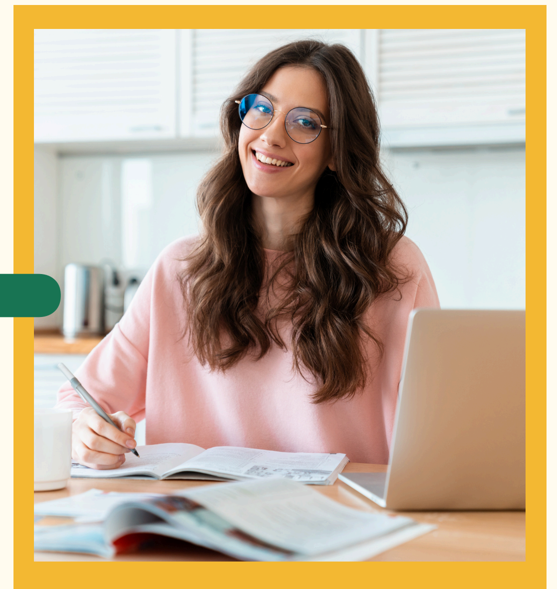
Talleres Bienestar Estudiantil