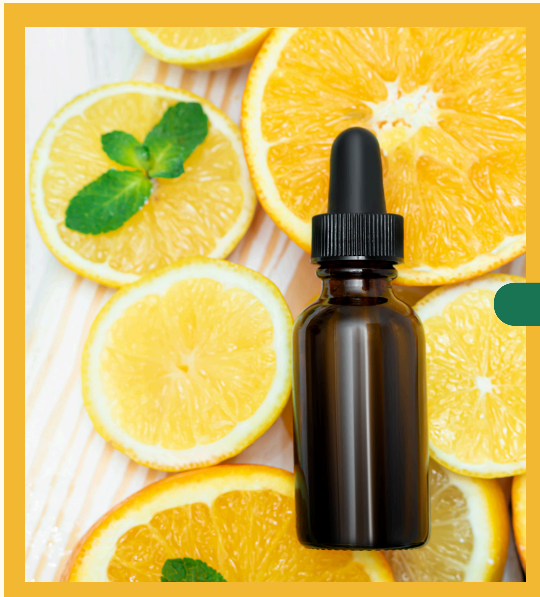
Masterclass Gratuita Aceites Esenciales