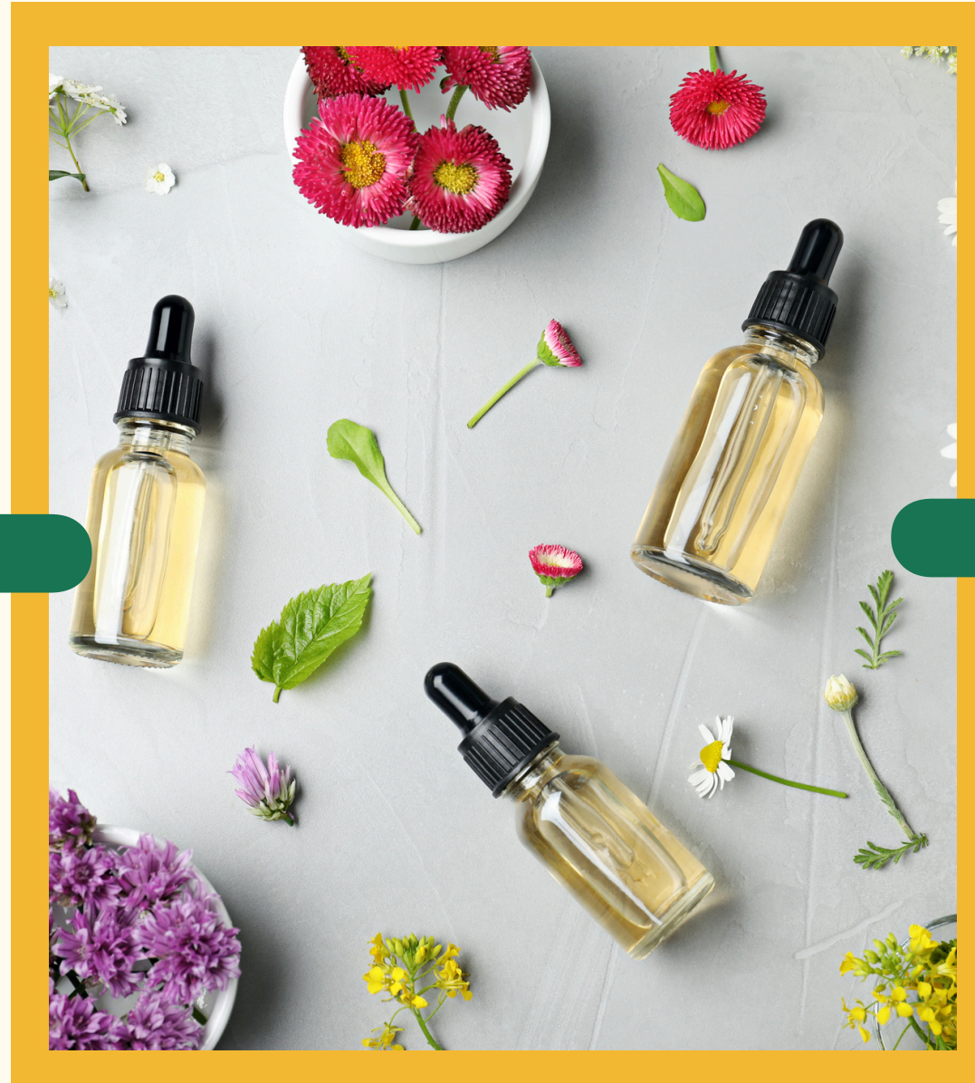
Masterclass Gratuita Aceites vegetales